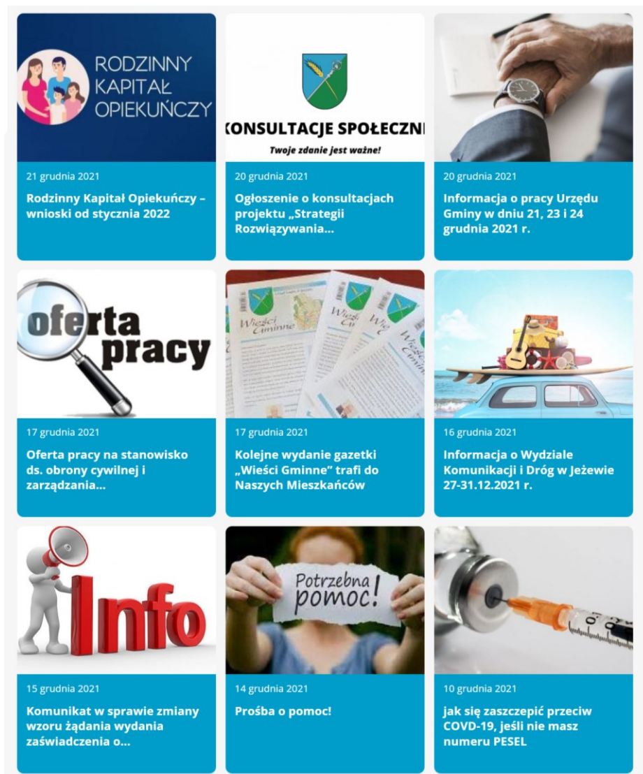
Zrzut ekranu ze strony internetowej gminy Jeżewo