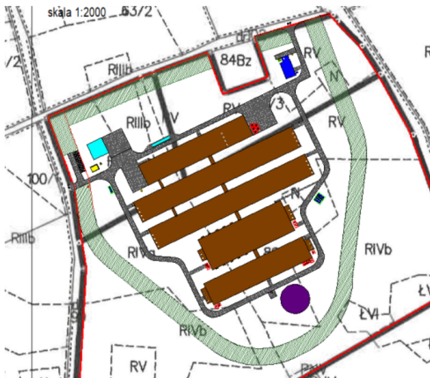
Rys. 2. Lokalizacja pasów nasadzeń wokół terenu inwestycji (kolor zielony).