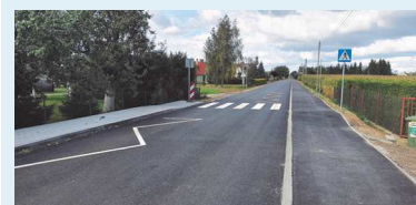
Droga do Czerska Świeckiego