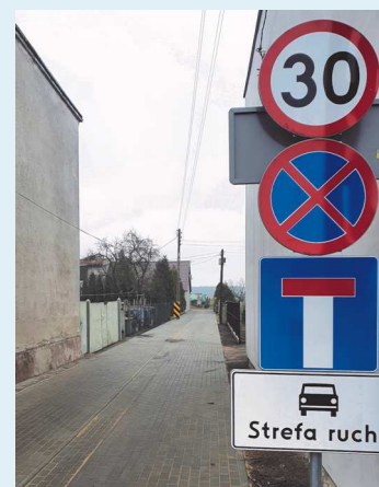
Kostka brukowa na ul. Świeckiej