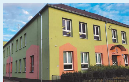
Nowe rynny na starej części szkoły