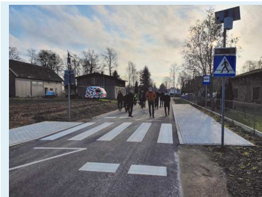
Odbiór drogi Osłowo - Krąplewice