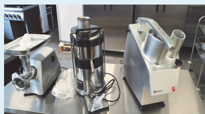
Wyposażenie szkolnej kuchni