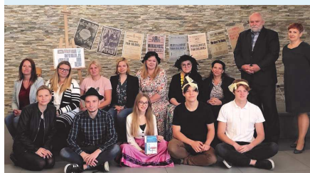
Wspólne zdjęcie uczestników akcji „Narodowe Czytanie”