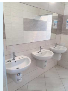
Łazienka po remoncie