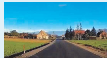
Nowa nawierzchnia drogi Taszewskie Pole - Ciemniki