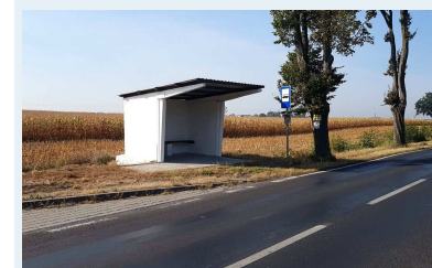
Jedna z wyremontowanych wiat przystankowych