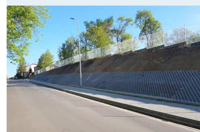
Ciąg rowerowo-pieszy na ulicy Świeckiej w Jeżewie

11. Dzięki zaangażowaniu wójtów oraz starosty świeckiego uruchomiono 8 linii Powiatowych Przewozów Użyteczności Publicznej. Trzy linie autobusowe prowadzą przez Gminę Jeżewo.