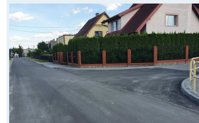
Wyremontowana nawierzchnia ulicy Szkolnej w Laskowicach