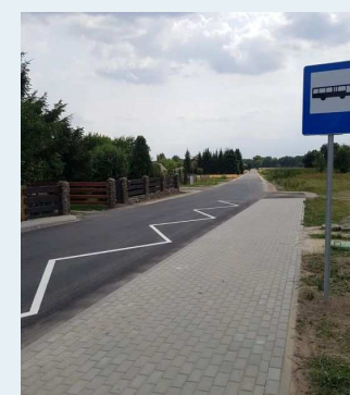
Nowa droga gminna w Krąplewicach