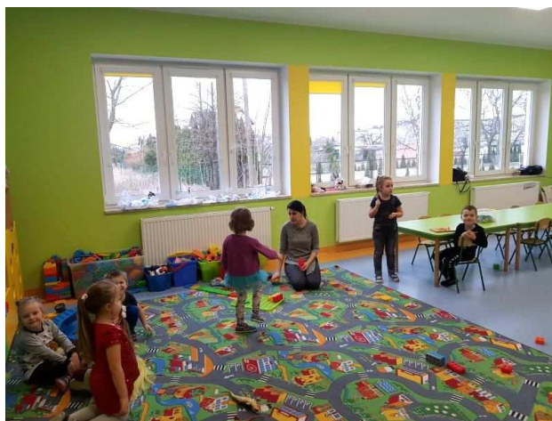
Jedna z sal w nowej części szkoły w Laskowicach