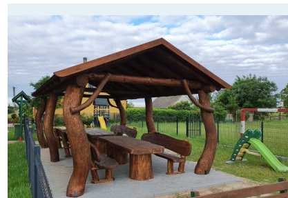
Altana wypoczynkowa w Taszewskim Polu

Koszt inwestycji 9000 zł. (Całość środków pochodzi z funduszu sołectkiego wsi Taszewskie Pole, który to fundusz pochodzi z budżetu gminy).