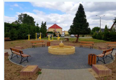
Miejsce rekreacji w Laskowicach

Koszt inwestycji 162 599,31 zł (Dofinansowanie z Europejskiego Funduszu Rozwoju Regionalnego w ramach Regionalnego Programu Operacyjnego na lata 2014-2020 wyniosło 127 487,08 zł).